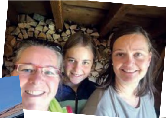
Fleißige Helferinnen beim Holzschopf auffüllen