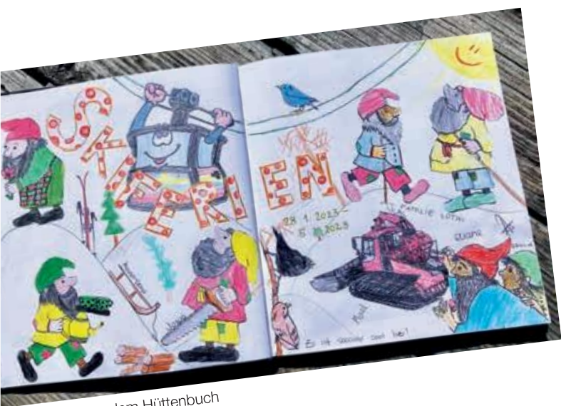
Auszug aus dem Hüttenbuch