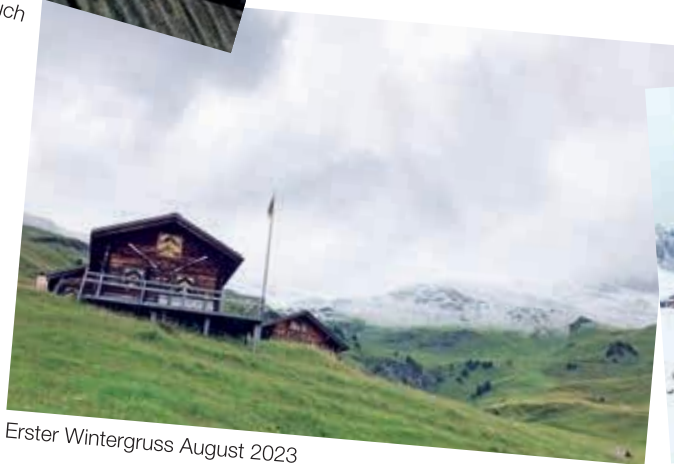
Erster Wintergruss August 2023