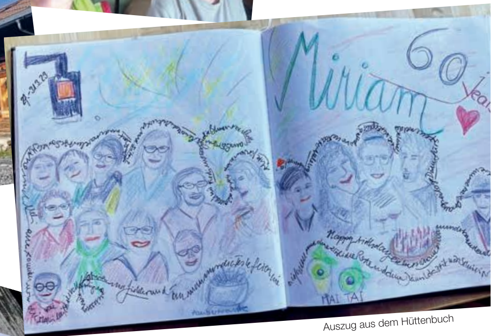
Auszug aus dem Hüttenbuch