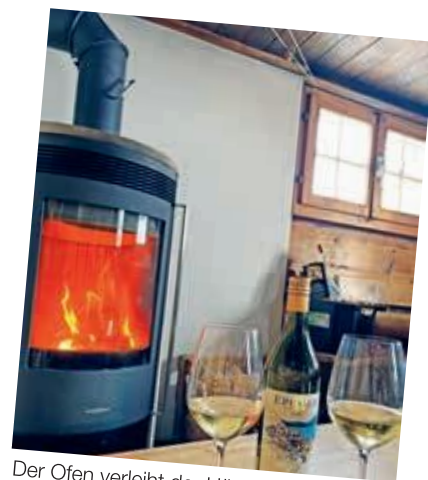
Der Ofen verleiht der Hütte zusätzliche Gemütlichkeit