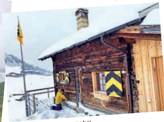
Bei jedem Wetter etwas zu tun