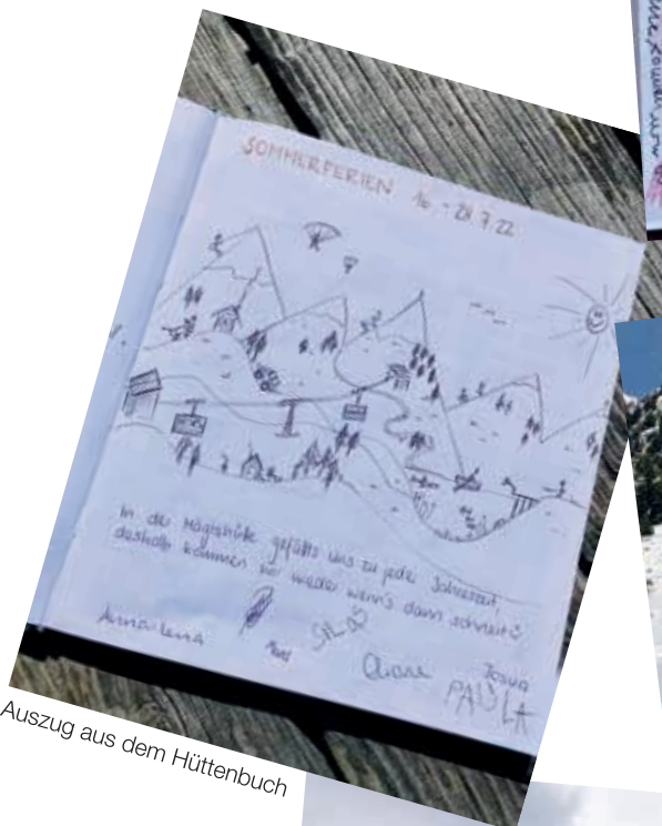
Auszug aus dem Hüttenbuch