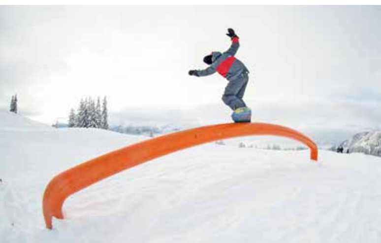
Tricks auf dem Rainbow-Rail und Kicker

Im Schnee konnten diese Bewegungen am 15. Dezember 2018 beim ersten Training am Hasliberg umgesetzt werden. Von da an war alle zwei Wochen ein Tagestraining ange-