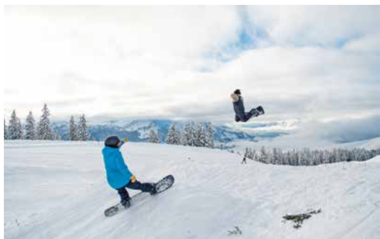
Weitere Höhenflüge aus dem Balispark