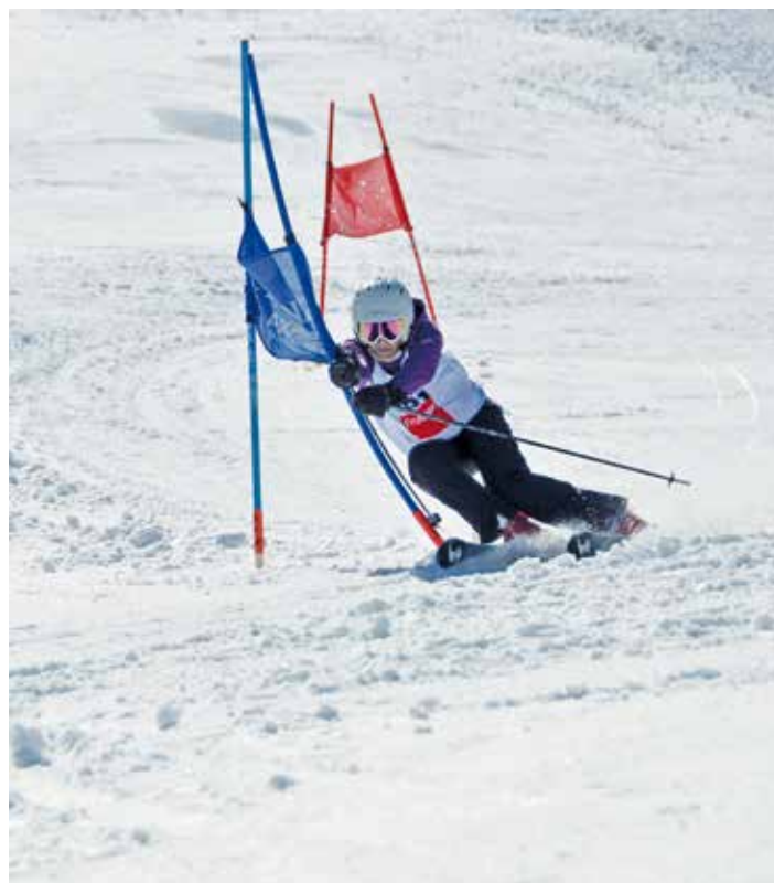
Michel Gruppe Cup 2019