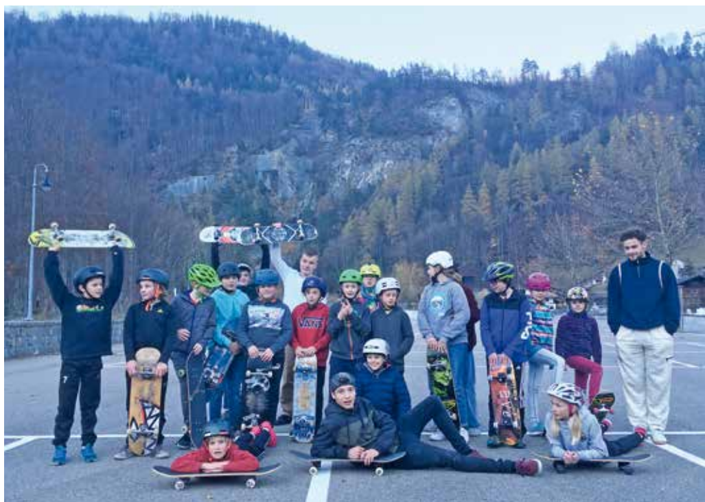
Skate-Training im Dedicated Skatepark Haslital