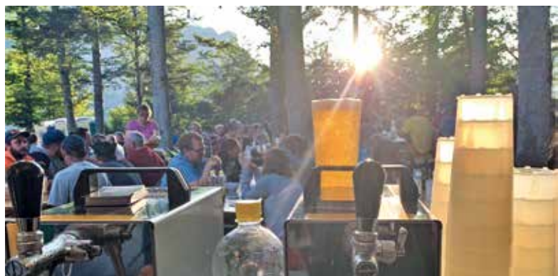
Zufriedene Gäste beim traditionellen Fyrabebier im Alpbachwald