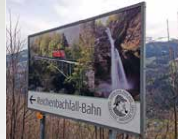
Fahrzeugbeschriftungen, Textilien, Plakate – mit grosser Wirkung