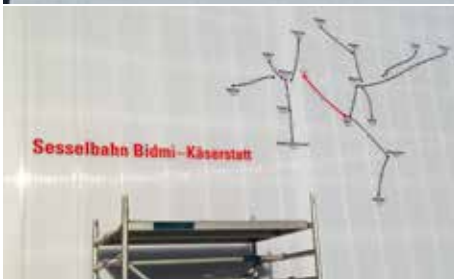
Unterwegs im Skigebiet