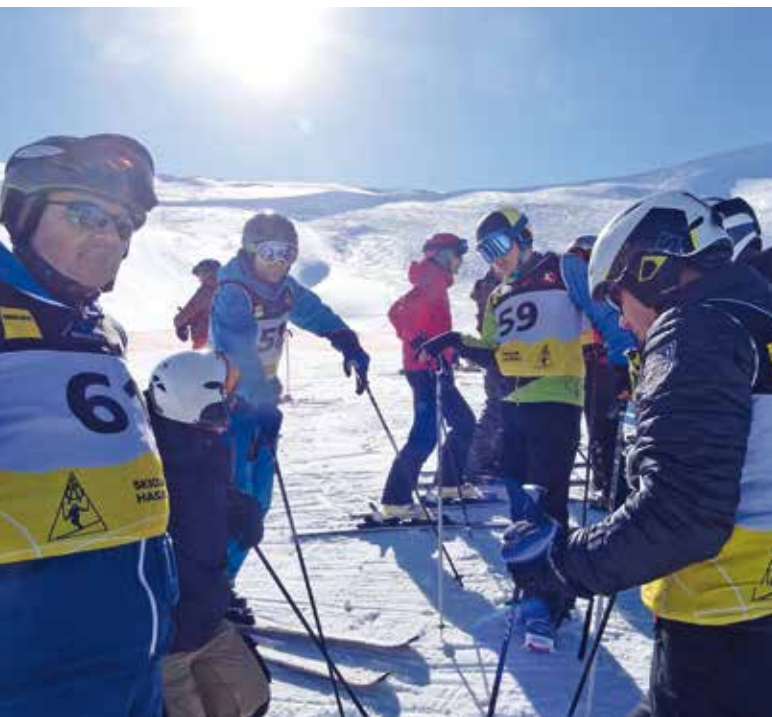
Konzentration vor dem Rennen