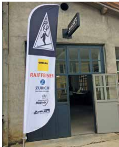
Beachflag Skiclub Haslital