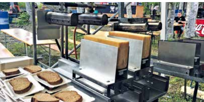
Alles bereit – es kann losgehen...