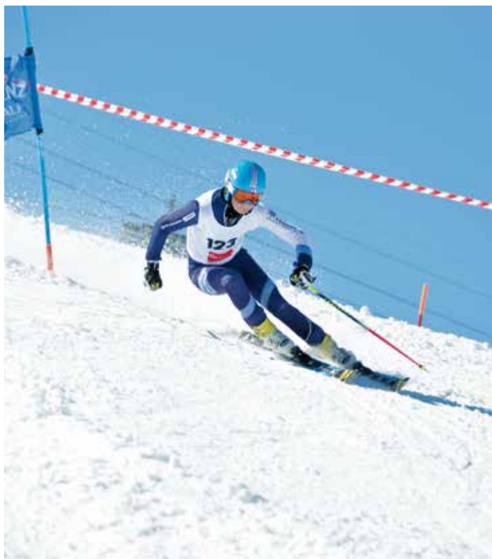
Michel Gruppe Cup 2019

Voll motiviert bei top Wetter und super Schneebedingungen